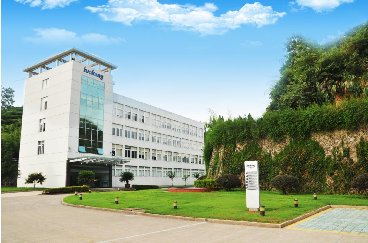
浙江华康药业股份有限公司外景